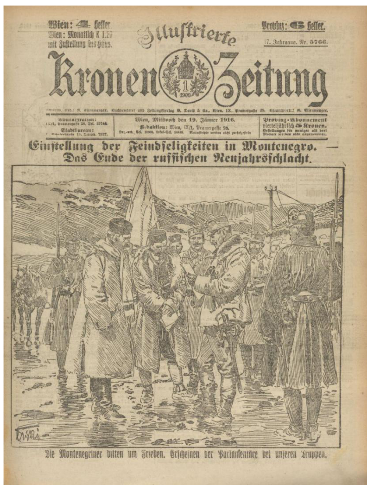
Илустрација бр. 5:наслов: „Престанак непријатељског деловања у Црној Гори“, текст: „Црногорци моле за мир. Долазак парламентарца код наших трупа.“ (Kronen Zeitung, 19. 1. 1916, насловна страна).

Sarajevski list преноси 24. јануара извештај из Рима по којем је „у Лион допутовала краљица Милена са две ћерке и снајом Наталијом, док су принчеви Мирко и Петар остали са оцем, краљем Николом, у Скадру“. Већ следећег дана, пак, исти лист доноси вест о приспећу краља Николе и принца Мирка у Италију и њиховом наставку пута за Лион.