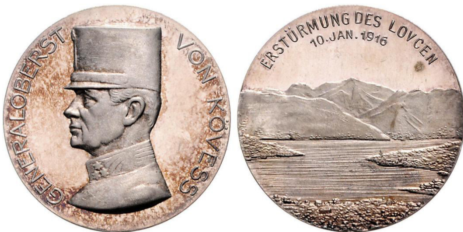
Аустроугарска медаља за храброст